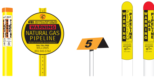
정규 파이프라인 표지판 예시