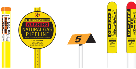
永久性管道标志的例子